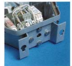
RLX wall mounting