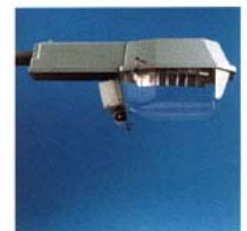
RLX-L gear compartment + side-entry (Ø 42 upto 60mm) mounting