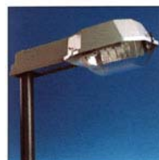
RLX-L This slim PC diffuser is only available for tubular lamps