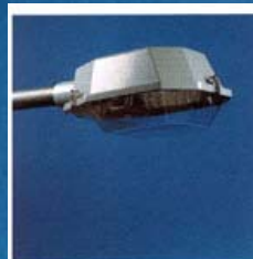
RLX side-entry (Ø 42 upto 60mm) mounting